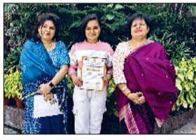
सोनीपत। कॉलेज लौटने पर छात्रा के साथ प्राचार्य एवं अन्य।