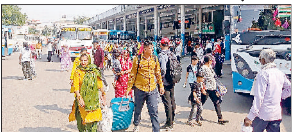
सोनीपत। बस अड्डा परिसर से बाहर आते यात्री।

हैप्पी कार्ड योजना के तहत आवेदन करने वाले जिले के 19500 यात्रियों को जल्द कार्ड का वितरण किया जाएगा। सरकार की ओर से सोनीपत बस डिपो में यह नए हैप्पी कार्ड भेज दिए गए हैं। कार्ड वितरण के लिए जिला रोडवेज विभाग के अधिकारियों ने टीमों का गठन किया है। टीमों में नियुक्त कर्मचारी जल्द मोबाइल के माध्यम से लाभार्थियों को संपर्क साधकर कार्डों का वितरण करेंगे। साथ ही बस अड्डा परिसर में हैल्प डेस्क भी स्थापित किया जाएगा। सरकार ने रोडवेज बसों में