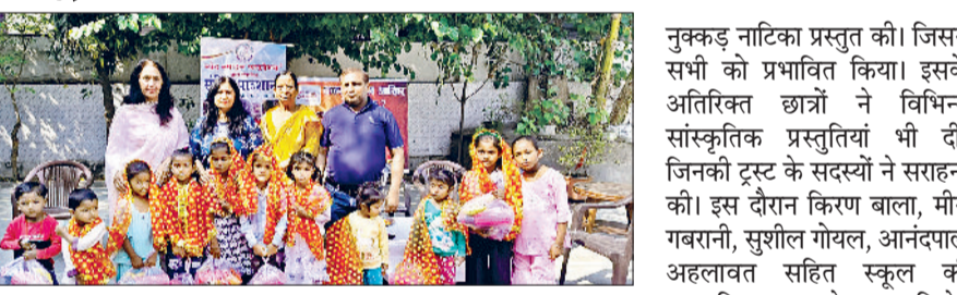
सोनीपत। शिव मंदिर स्थित निशुल्क पाठशाला में कन्या पूजन कार्यक्रम में मौजूद सारथी जन सेवा चैरिटेबल ट्रस्ट के सदस्य।

सारथी जन सेवा चैरिटेबल ट्रस्ट ने नवरात्रों के अवसर पर शिव मंदिर, बस स्टैंड के सामने, शिवाजी कॉलोनी में कन्या पूजन कार्यक्रम का आयोजन किया। कार्यक्रम का विशेष कार्यक्रम की भांति सामाजिक जागरूकता विषय कन्या पूजन आखिर कब तक? की थीम पर