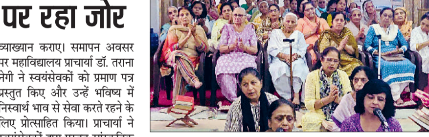
सोनीपत। कार्यक्रम के दौरान उपस्थित श्रद्धालुगण।

गांव राजलू गढ़ी में समाज सुधार संकल्प समिति द्वारा स्वच्छता अभियान के तहत गांव के राजकीय स्कूल में विशेष सफाई अभियान चलाया। समिति के सदस्यों ने बूढ़-चढ़कर भाग लेते